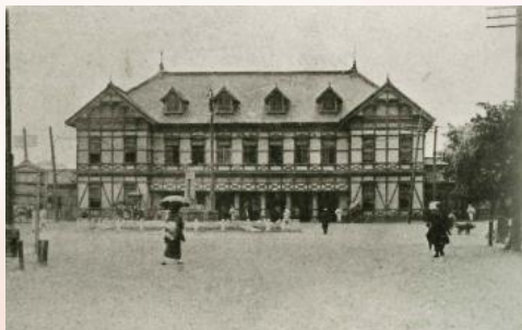
▲旧下関駅(大正六年)