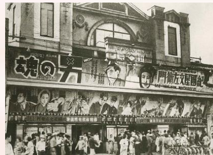
▲山陽倶楽部(昭和十年ころ)