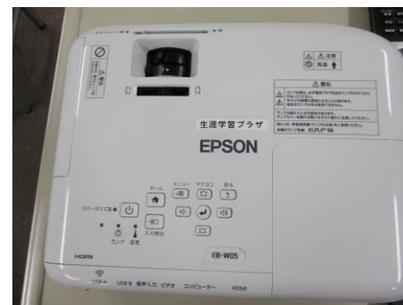
EPSON EB-W05 (明るさ3,300lm)