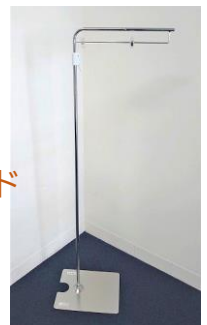
クリップスタンド