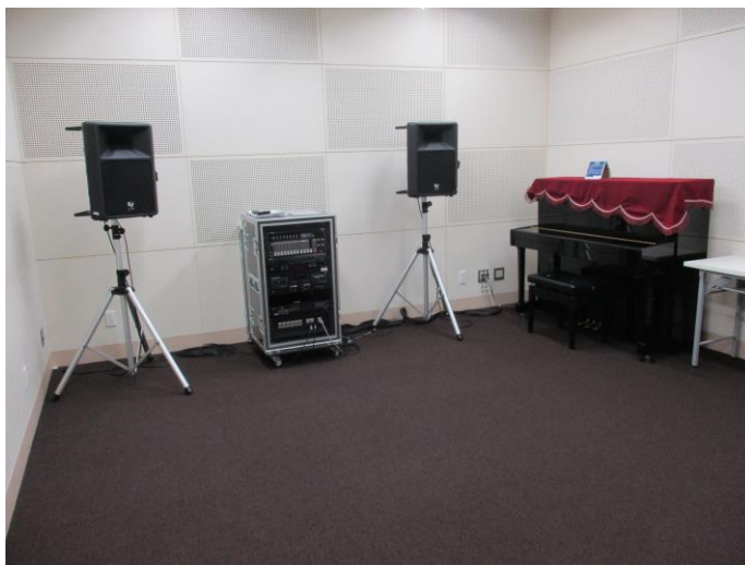
出入口から見たところ