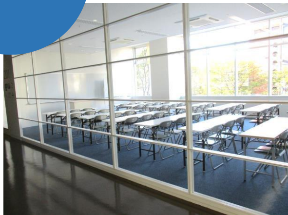
通路から見たところ

※学習室1と学習室2は、パーティションで仕切られています。(音漏れの可能性あり)