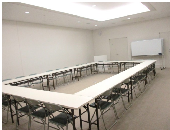
出入口から見たところ