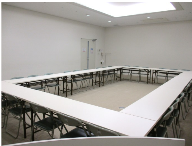
前方(講演台)から見たところ