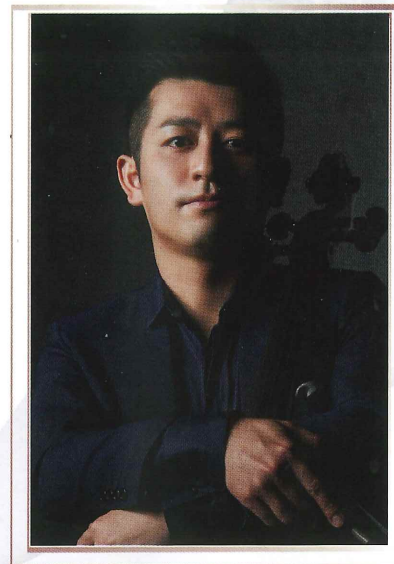
チェロ 宮田 大

使用楽器は、上野製薬株式会社より貸与された1698年製A. ストラディヴァリウス“Cholmondeley”である。