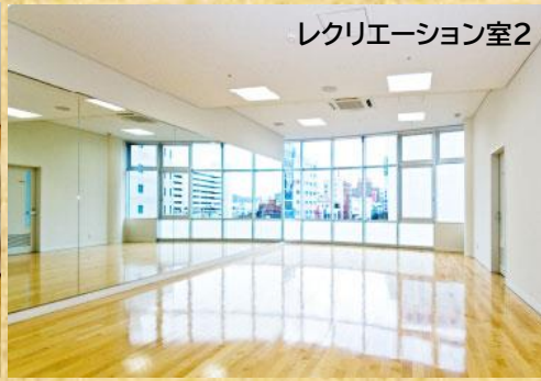
レクリエーション室2

ドリームシップ3階にあるレクリエーション室は2部屋あります。どちらの部屋も鏡張り窓があるので、明るく開放感があります。ダンス練習や室内の運動教室などに使用できます。