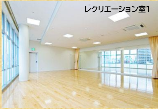
レクリエーション室1