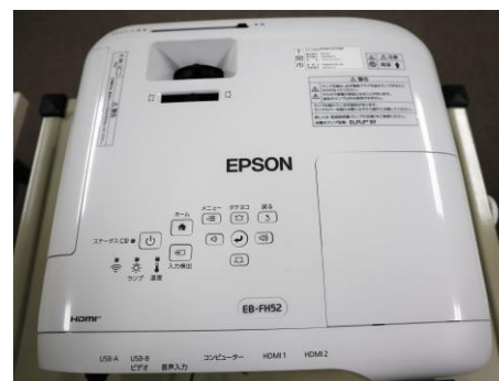
EPSON EB-FH52 (明るさ4,000lm)