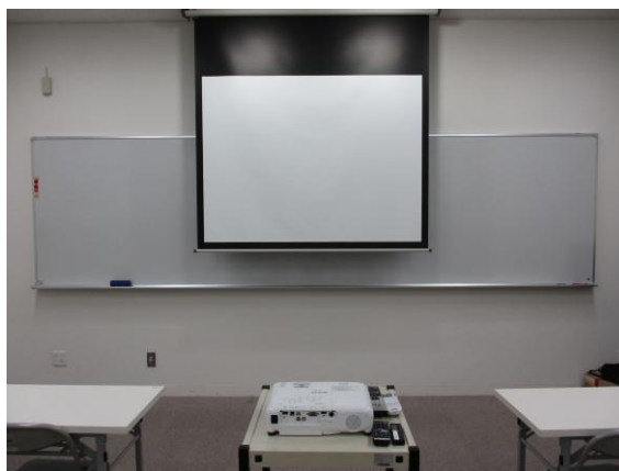
スクリーンを降ろしたところ